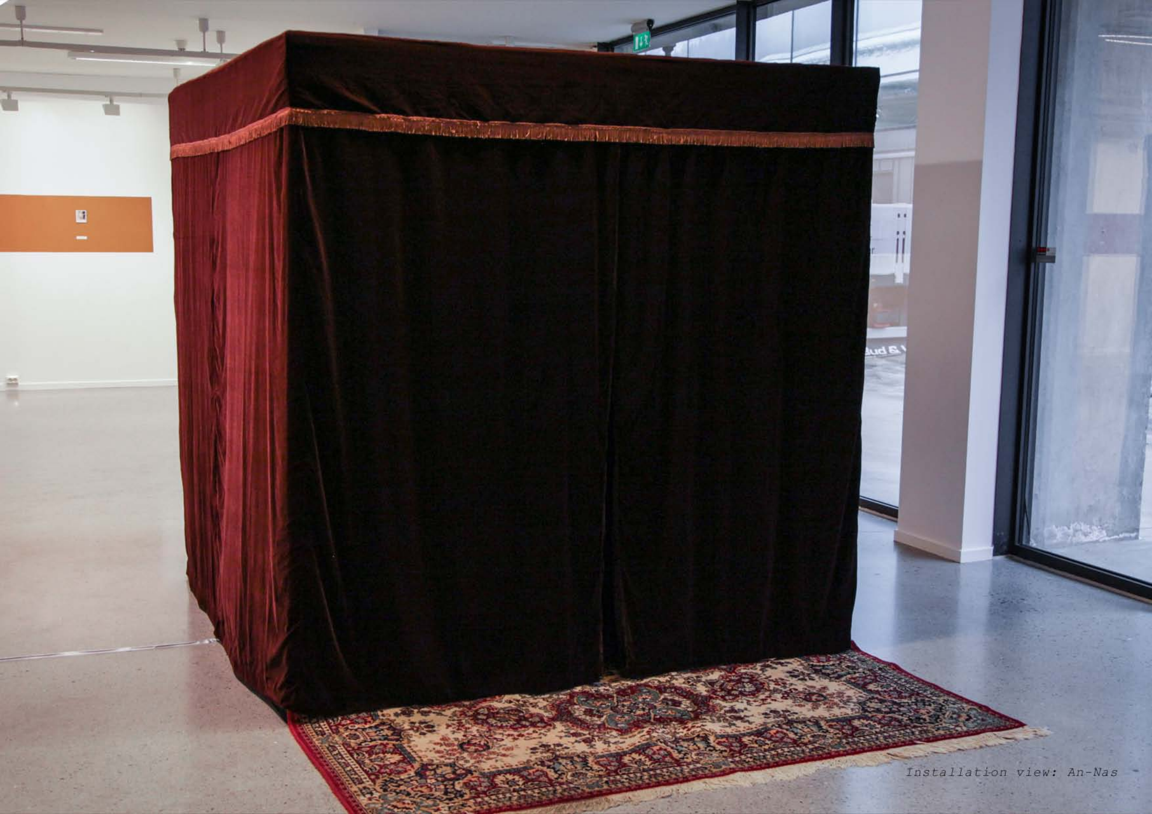
Installation view: An-Nas