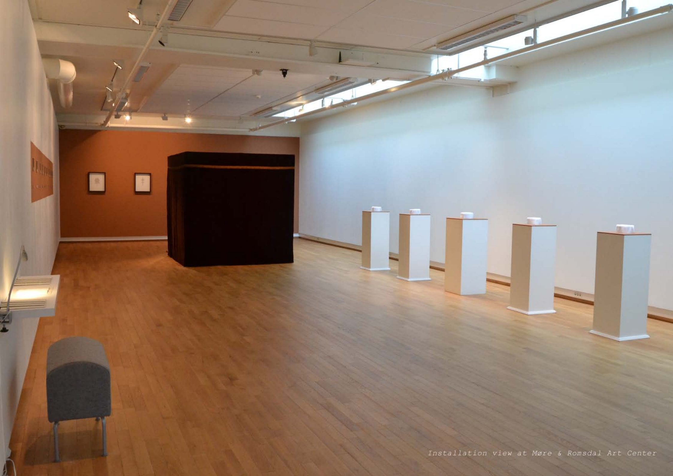
Installation view at Møre & Romsdal Art Center