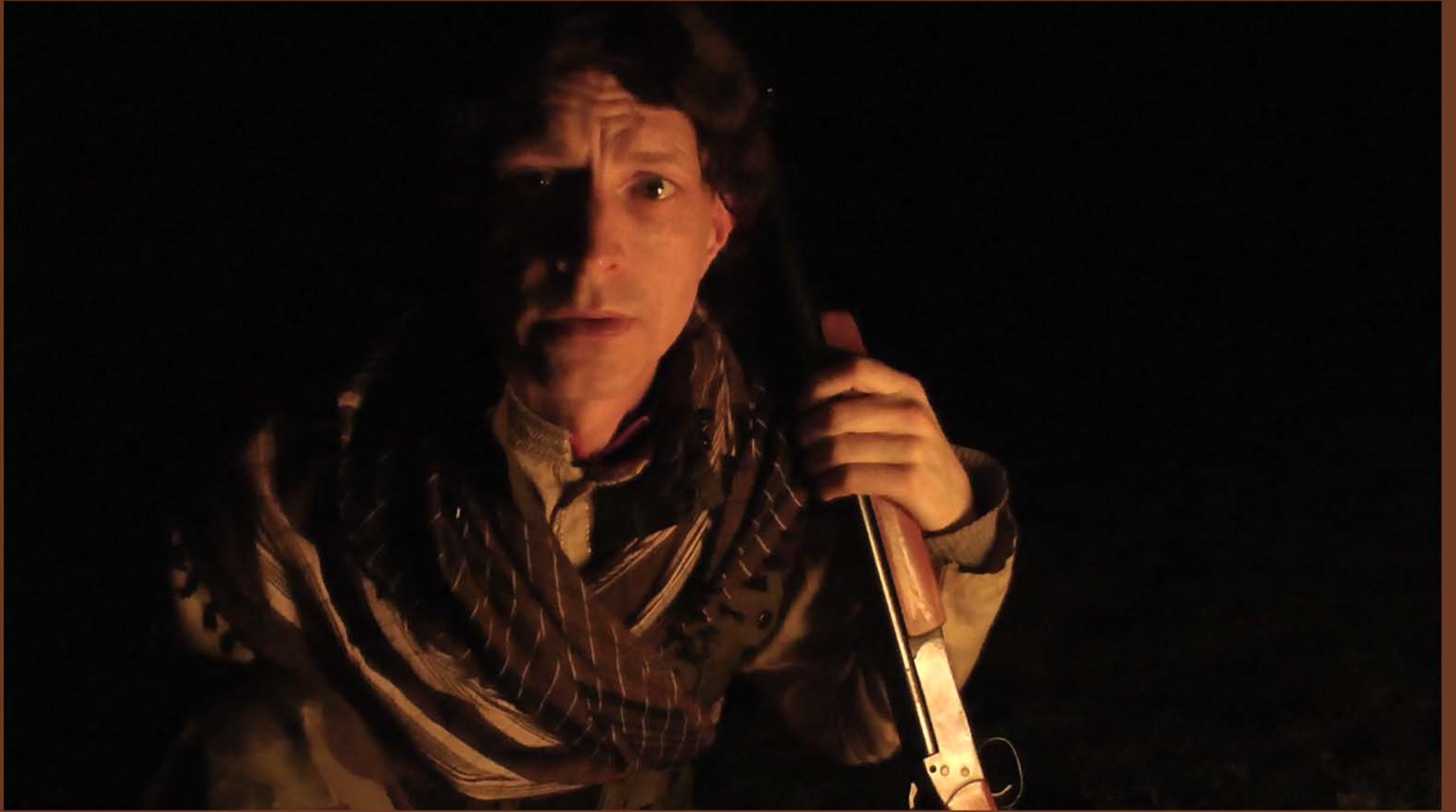
Video still: Al Sajdah