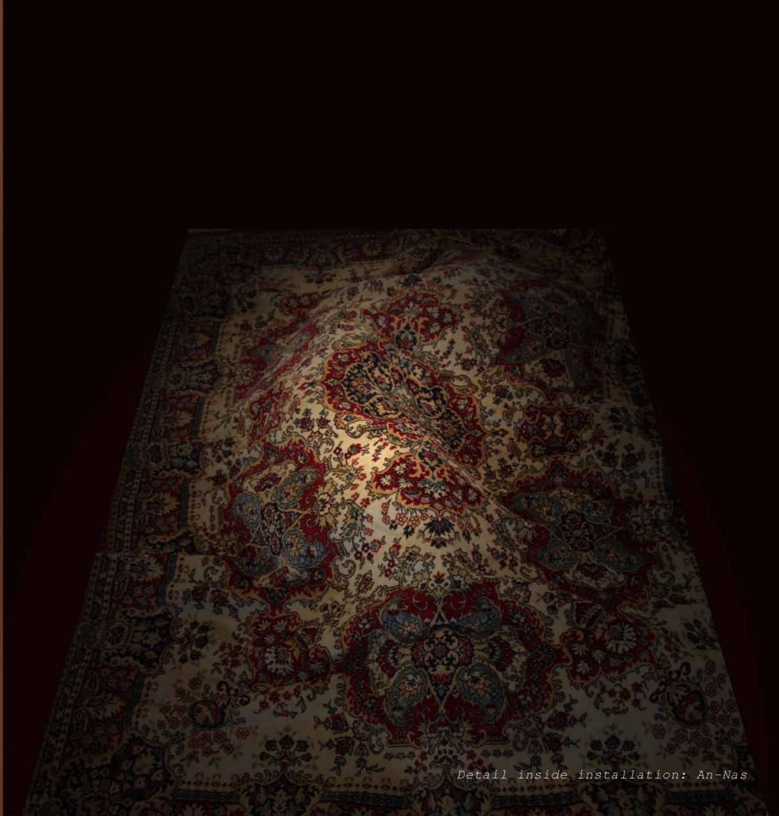
Detail inside installation: An-Nas