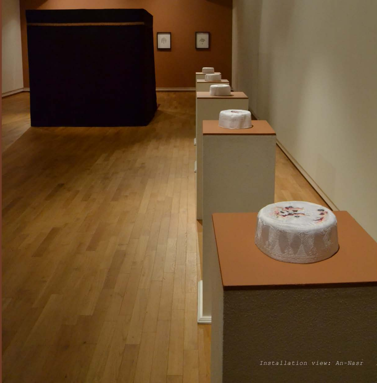
Installation view: An-Nasr